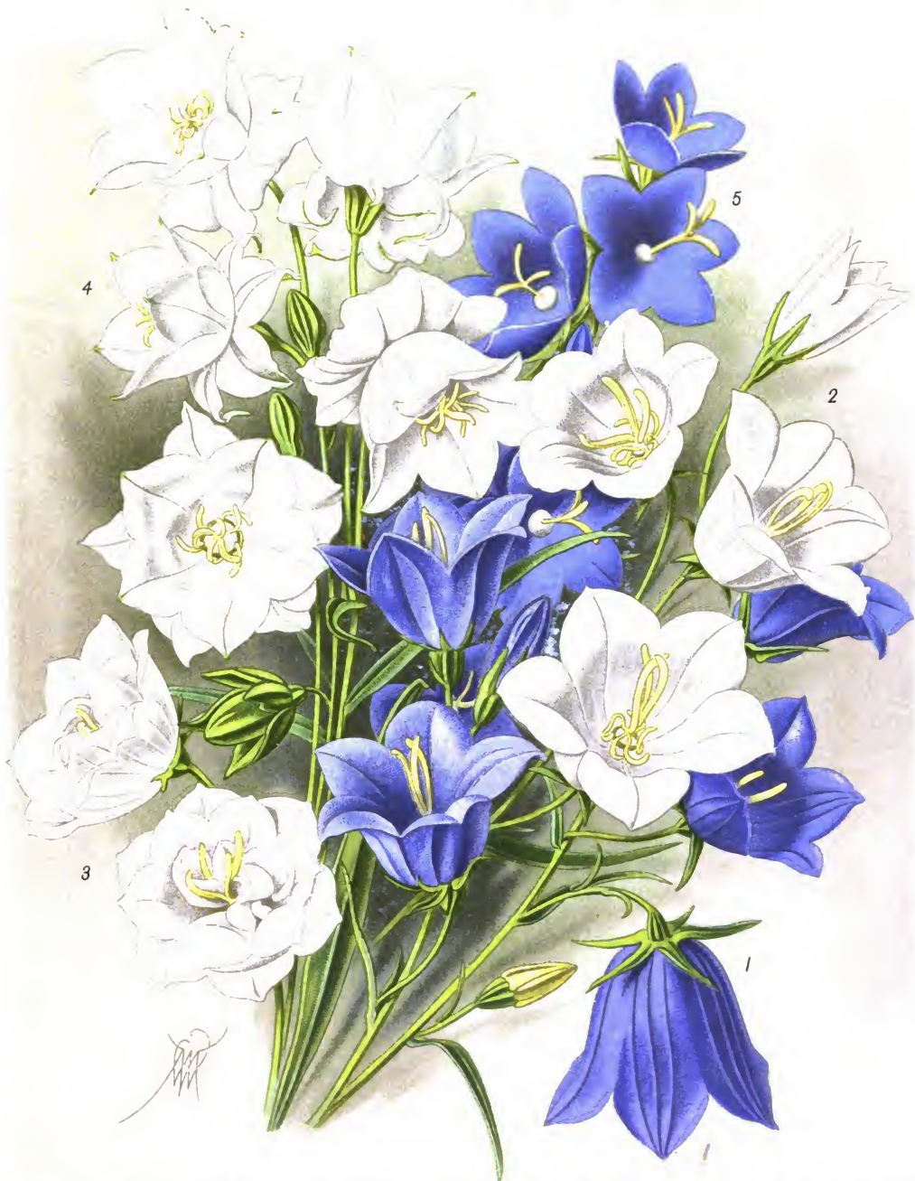
Campanula persicifolia L. var. grandiflora (1.); var. alba (2.); var. alba flore pleno (3.) var. coronata (4.); Campanula latiloba D. C. (5.)

Колокольчик персиколистный крупноцветный [1.]; его разновидности: белоцветная [2.]; белоцветная махровая [3.]; увяччанная [4.] и колокольчик олимпийский [5.].